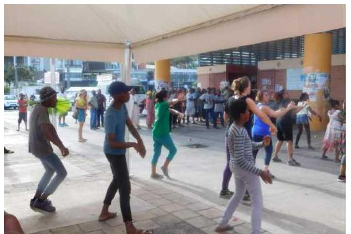
Cours de zumba gratuit animé par Vis ta Forme