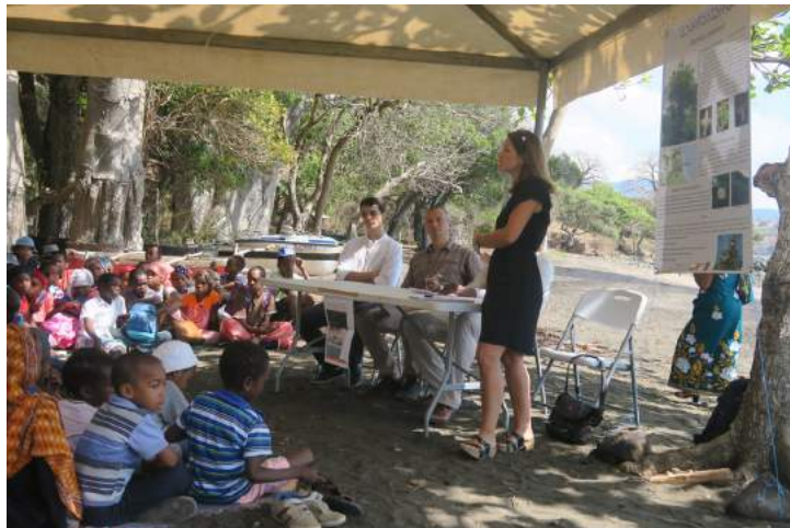
Réunion de sensibilisation pour la protection du Foetidia comorensis le 6 octobre 2017 à Mutsumudu