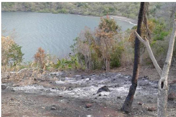
Brûlis dans la presqu'île d'Handrema