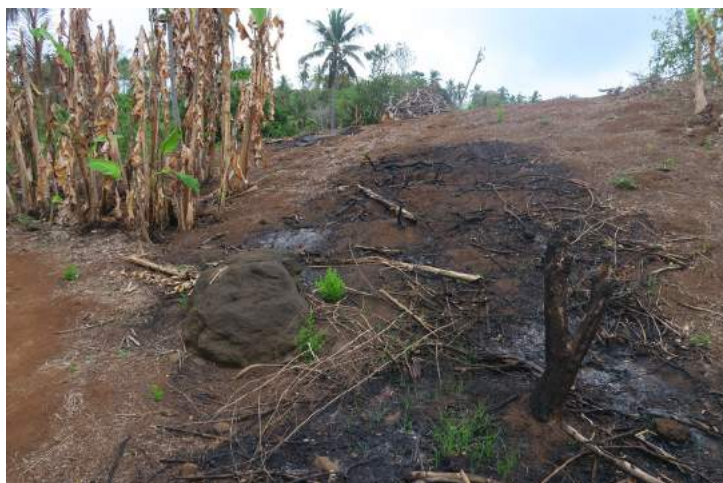
Brûlis sur terrain en pente près de Mtsangamouji

Les brûlis favorisent l'érosion et une baisse de la fertilité des sols en même temps qu'ils entraînent l'envasement du lagon. Les brûlis constituent une plaie pour l'agriculture et pour le lagon. Signalez nous les cas de brûlis avec localisation aussi précise que possible et photographies. Merci de votre aide.