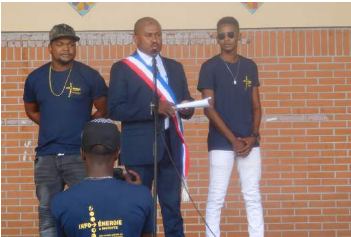
Discours d'ouverture par l'adjoint au maire de Mamoudzou

Malgré un temps pluvieux, les messages de sensibilisation semblent avoir été bien reçus par les participants. L'Espace Info Energie a pour objectif de faire prendre de l'ampleur à cet événement pour la 5ème édition qui sera organisée l'année prochaine !