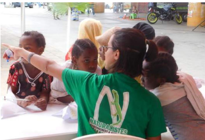
Jeux et animations sur l'énergie par les Naturalistes de Mayotte