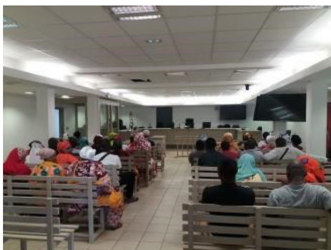
Procès des trois braconniers, le 12 août 2019

Ces interpellations démontrent une volonté de ne pas laisser impunis ces actes de braconnage, mais également que le chemin est encore bien long avant que cette activité illégale ne cesse à Mayotte.